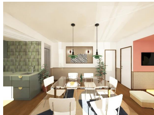
PROJECTION CHAMBRE EDGAR SUITES