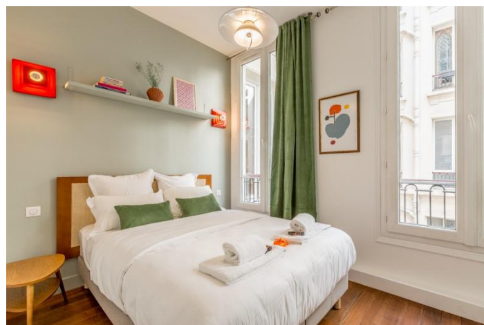
PROJECTION CHAMBRE EDGAR SUITES