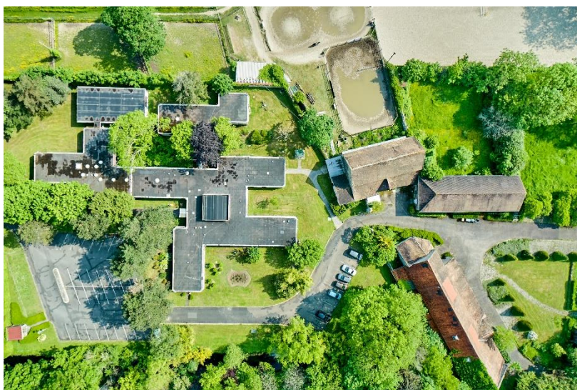
Le secteur du domaine de La Grange-la-Prévôté objet de l'AMI

Fin juillet 2023, l'Etablissement Public d'Aménagement de Sénart (EPA Sénart) a lancé un appel à manifestation d'intérêt (AMI) pour identifier l'opérateur qui portera le projet de reconversion à vocation mixte, à la fois économique et touristique, sur le domaine de La Grange-la-Prévôté. D'une superficie de 1,7 hectare, le site du domaine concerné par l'AMI, situé à immédiate proximité de l'emblématique château de La Grange-la-Prévôté, comprend les parcelles accueillant les actuels locaux de l'EPA Sénart ainsi qu'une ancienne ferme.