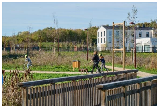
Les espaces paysagers de l'Écoquartier du Balory.