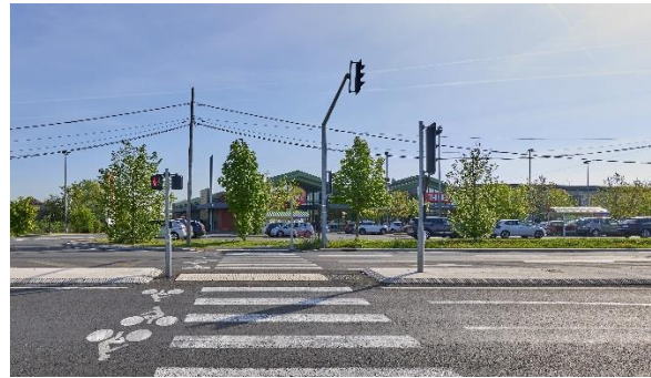
La nouvelle rue de l'Attaque du Courrier de Lyon, et le carrefour à feux de la RD306, à Vert-Saint-Denis.